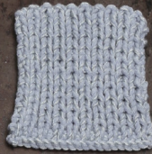
Cosy: Sky blue SBF: Light Grey