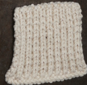
Cosy: Off White SBF: Off White