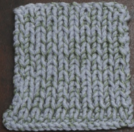
Cosy: Sky Blue SBF: Soft Green