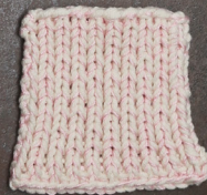
Cosy: Off White SBF: Light Pink