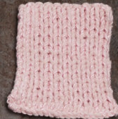
Cosy: Pastel Rose SBF: Light Pink