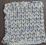
Cosy: Off White SBF: Jeans Blue