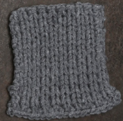
Cosy: Grey SBF: Grey