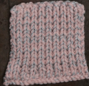
Cosy: Pastel Rose SBF: Light Grey