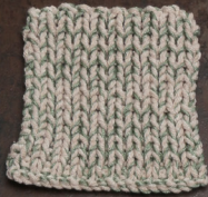
Cosy: Pastel Brown SBF: Soft Green