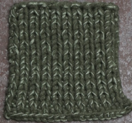
Cosy: Hunting Green SBF: Soft Green