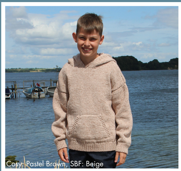
Cosy: Pastel Brown, SBF: Beige

Nøglen til at strikke en bestemt størrelse, handler mere om strikkestilen end om størrelsen på pindene. Derfor anbefaler vi altid et spænd af pindestørrelser.