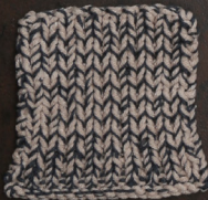
Cosy: Pastel Brown SBF: Dark Grey