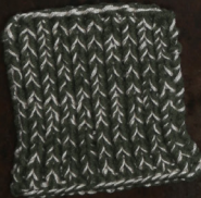
Cosy: Hunting Green SBF: Off White