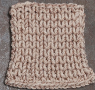
Cosy: Pastel Brown SBF: Nude Beige