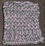
Cosy: Grey SBF: Light Pink