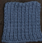
Cosy: Jeans Blue SBF: Jeans Blue